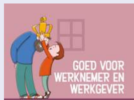
GOED VOOR WERKNEMER EN WERKGEVER

Door middel van ruimte voor eigen inbreng, reflectie op je handelen en gesprekken over de diversiteit van waarden en normen in onze maatschappij.