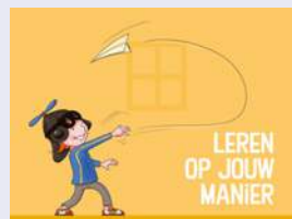
LEREN OP JOUW MANIER

We voelen ons ambassadeur van Eenbes, onze scholen zijn herkenbaar in stijl en in handelen, elke medewerker geeft zich een acht op de werkgelukmeter en hebben we personeelsbeleid met een prominente plaats voor persoonlijk leiderschap en mobiliteit.